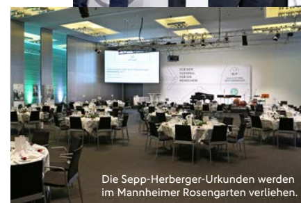
Die Sepp-Herberger-Urkunden werden im Mannheimer Rosengarten verliehen.

In den Kategorien Behindertenfußball, Resozialisierung, Schule und Verein, „Corona-Engagement“ sowie „Fußball Digital“ werden je drei ausgewählte Vorschläge mit einem Geldpreis prämiert (1. Platz/5.000 Euro, 2. Platz/3.000 Euro, 3. Platz/2.000 Euro). In der Kategorie „Sozialwerk“ ist der „Horst-Eckel-Preis“ mit 5.000 Euro dotiert. Die Auswahl der Preisträger obliegt den Stiftungsgremien.